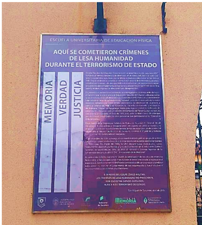
Imagen 1: Señalización en forma de Placa. Situado en la Facultad de Educación Física. Ex Centro Clandestino de Detención.