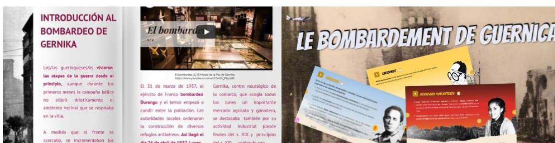
Foto 1: Recursos sobre el Bombardeo de Gernika

Todos estos materiales ofrecen una amplia gama de enlaces, textos y materiales que sirven de apoyo en la tarea de investigación que deben llevar a cabo los usuarios. Cabe destacar que la revista “El bombardeo de Gernika” es un documento independiente, aunque está también incrustado en el documento de investigación para facilitar las pesquisas del alumnado. Lo interesante de este documento es que podemos completarlo y ampliarlo en cualquier momento.