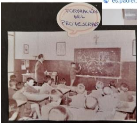
Figura 2. Cartel. Grupo Fresitas