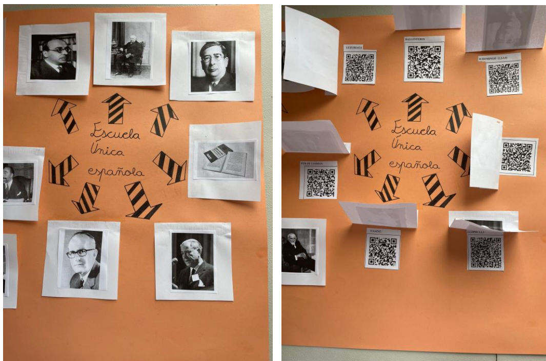
Figura 1. Grupo Naranjitos . Códigos QR para la Escuela Única. Contenido: Constitución de 1931, Luzuriaga, A. Ballesteros, M. Domingo, F. de los Ríos, F. Sainz y R. Llopis

En la sociedad actual, donde las nuevas tecnologías lo envuelven todo, los cambios culturales se aceleran y la Educación Primaria no deben quedar al margen 17 . La respuesta rápida es hoy una de las maneras más populares de comunicarse haciendo uso de los códigos QR (Quick Response Code) 18 . Con ellos, se establece una relación entre el diseño visual y el aprendizaje que estimula así como la posibilidad de pasar al cartel digital y el uso de QR 19 . Aunque la información se presenta a través del lector ubicado en el teléfono móvil, al inicio lo que se percibe es código bidimensional con aspecto de cuadrado. En la Figura 1 se recogen varios aplicados al cartel sobre Escuela Única en España.