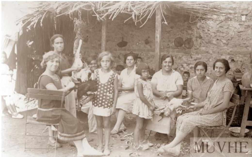
Figura 2. Preparativos de la cena en Isla Plana de Cartagena (Murcia, España). Exposición “Tarjeta postal ilustrada y educación (España, siglos XIX – XX)”. Panel 14.10.

(tema 4), los modelos de educación de las mujeres (tema 5) y la formación de las maestras desde una perspectiva histórica (tema 6).