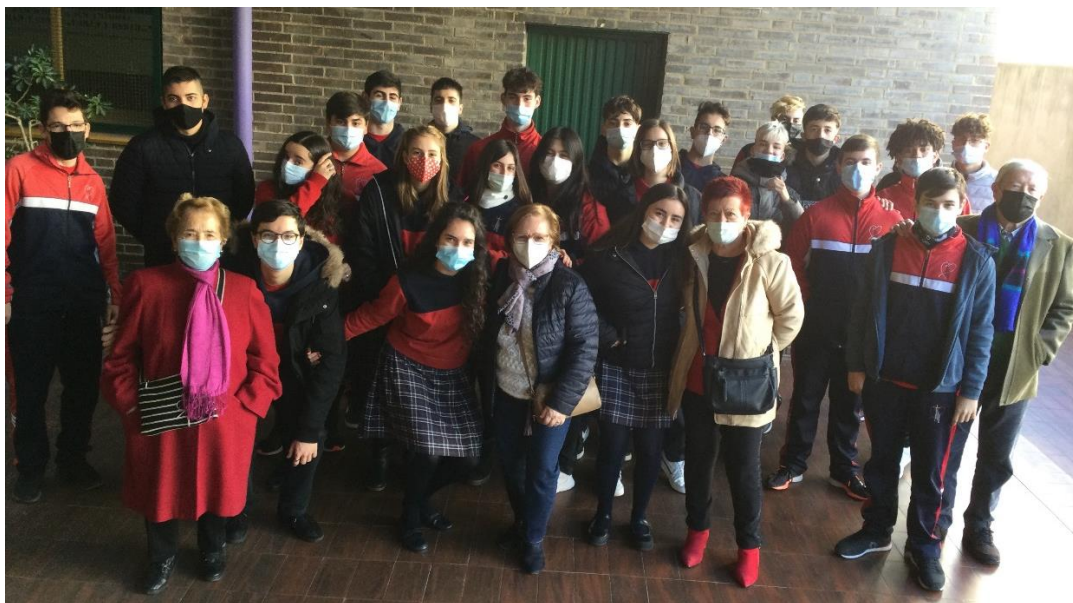
Fotografía 2: Asistentes a una de las sesiones de “La clase de los abuelos”, curso 21-22.

Y la última parte del proyecto consiste en un trabajo de investigación por grupos a partir de un guión que les doy y que, tras completarlo, deben realizar un Debate-Exposición en el que cada grupo debe defender su información y sus argumentos.